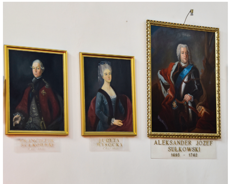
▲ Wspaniałą ilustracją do opowieści o dawnych Włoszakowicach są portrety ważnych postaci historycznych.