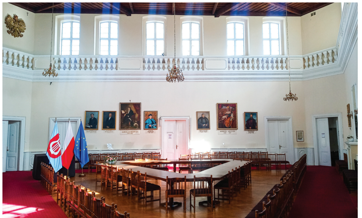
▲ Sala Trójkątna znajduje się pośrodku pałacu, a po bokach mniejsze pomieszczenia, w których urzędnicy mają swoje biura.