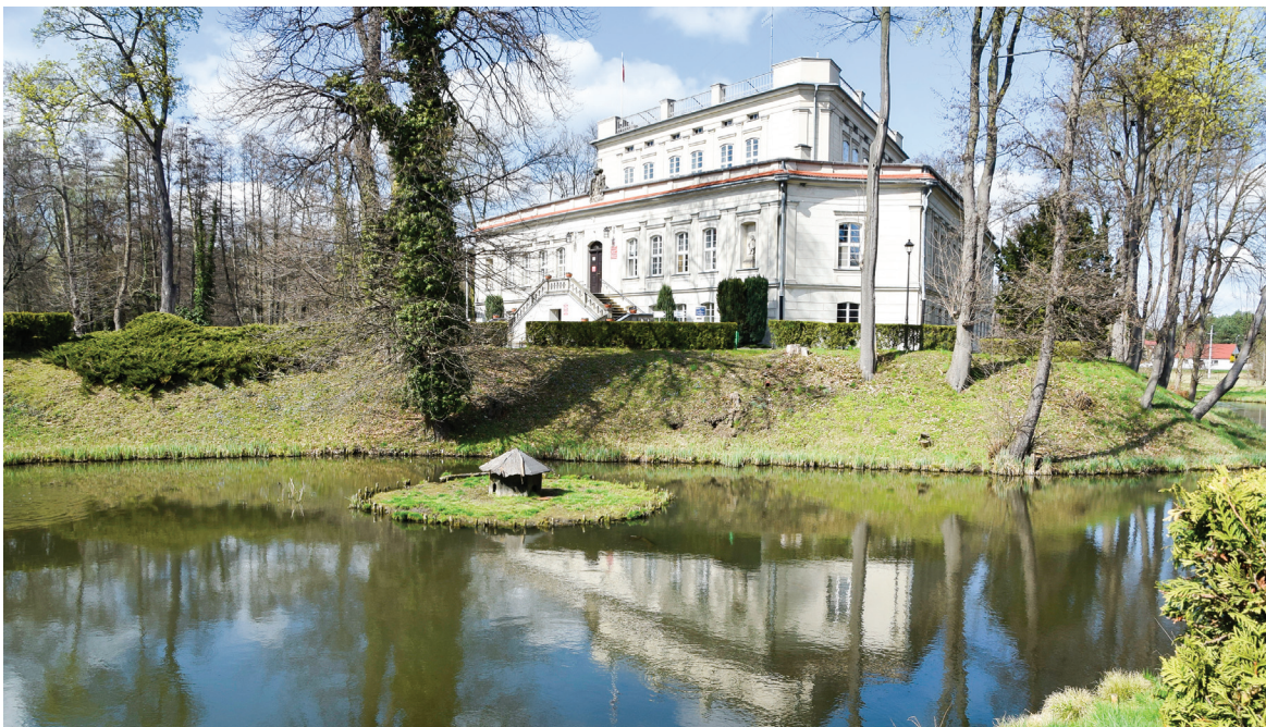
▲ Pałac we Włoszakowicach otoczony fosą. Jest jedynym w kraju wybudowanym na planie trójkąta.