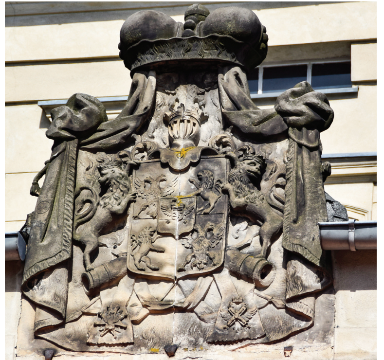
▲ Front pałacu zdobi herb Sułkowskich.

Pałac Sułkowskich można zwiedzać w godzinach pracy urzędu od 7.30 do 15.30 lub poza nimi po wcześniejszym umówieniu się z pracownikiem Gminnego Ośrodka Kultury – tel. 65 52 52 965. (JAC)