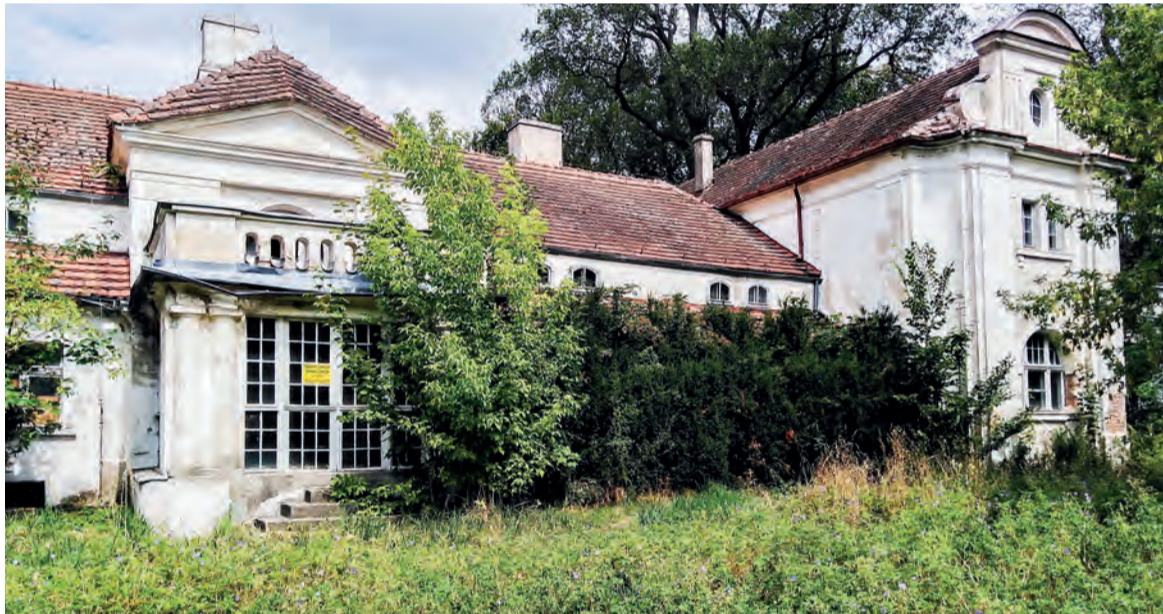
▲ Dwór w Oporowie obecnie popada w ruinę, ale przyglądając nieco oko na ten stan, można wyobrazić sobie jego świetność. Położony jest w rozległym parku, obecnie mocno zarośniętym „samosiejkami”.