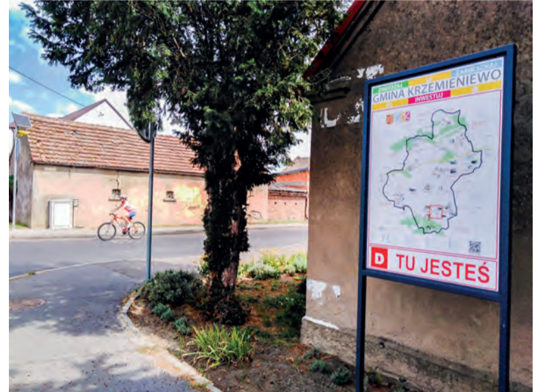
▲ Gmina Krzemieniewo w szczególności dba o rowerzystów. W wielu miejscach można spotkać mapy gminy z zaznaczonymi szlakami rowerowymi. To bardzo ułatwia wędrowkę, przede wszystkim turystom z innych regionów Polski, którzy postanowili przekonać się o pięknie ziemi leszczyńskiej.