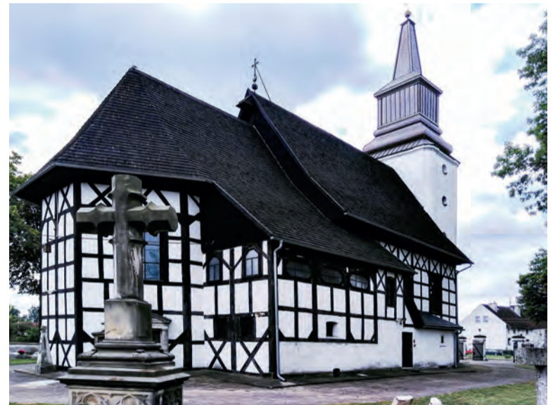
▲ Oporowski kościół wybudowany został w latach 1637-1644. W niemalże niezmiennym kształcie stoi do dziś nieopodal dawnych dworskich posiadłości.