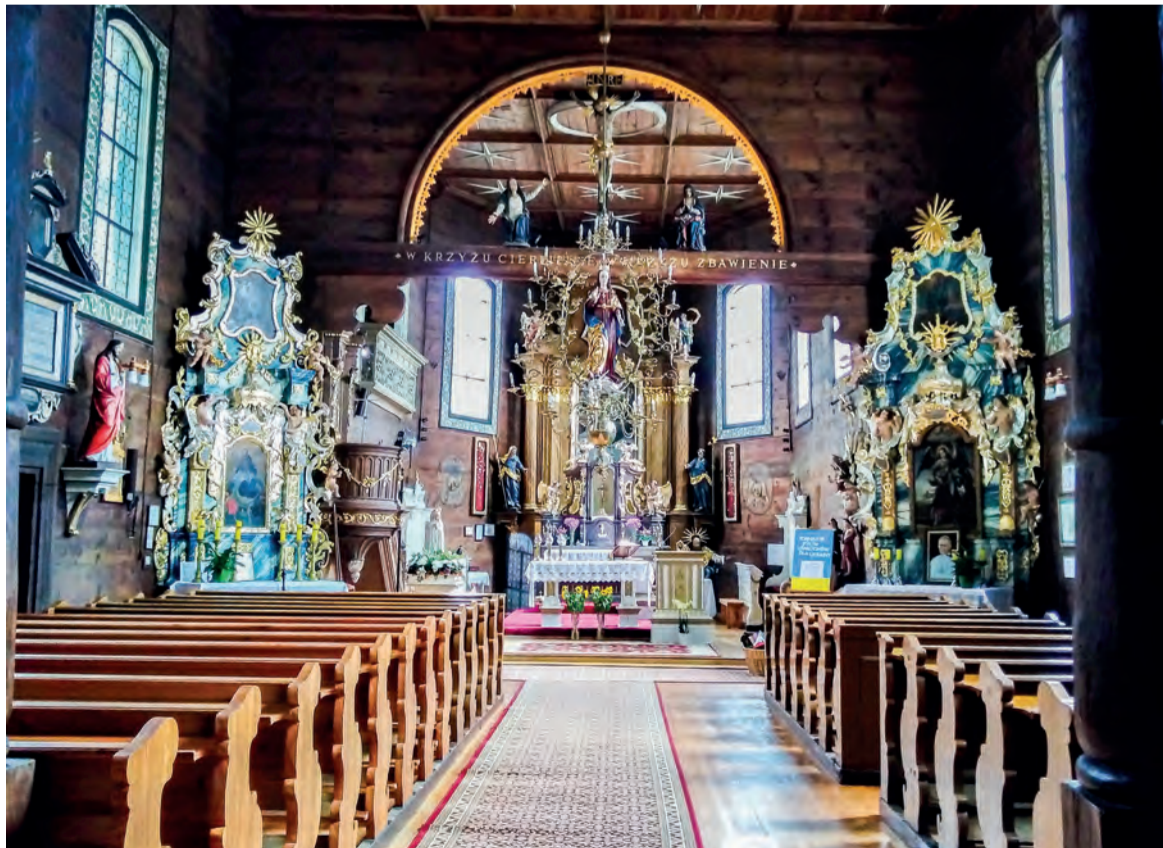
▲ Wnętrze kościoła pw. NMP Niepokalanie Poczętej można obejrzeć przez przeszkłone drzwi. Pełniej nastrój i piękno kościoła można odebrać podczas mszy świętych, które są odprawiane w niedziele o godz. 8 i 10:30 oraz w pozostałe dni tygodnia o godz. 18 (w okresie zimowym o godz. 17).