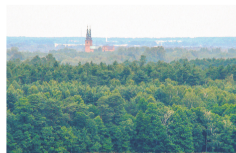
Widok z wieży widokowej w Dominicach

W sąsiednim Miastku znajduje się znane gospodarstwo agroturystyczne Trzciny Zakątek. To doskonały dowód, że nie trzeba wyjeżdżać daleko, by