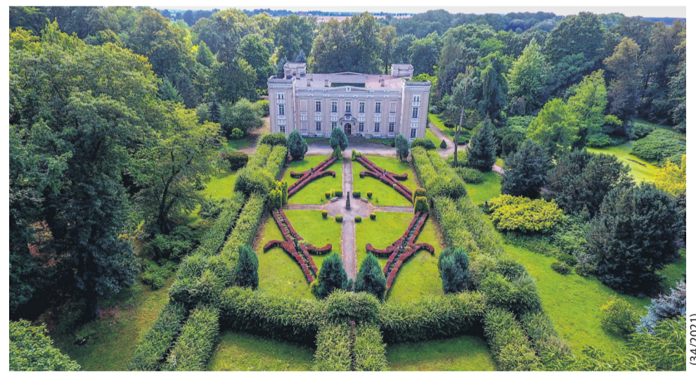
Pałac w Trzebinach

Na drogę powrotną z Boszkowa możemy obrać trasę rowerową przez fantastycznie zazieleniony o tej porze Krzyżowice i powracamy do Święciechowy. W sumie pokonaliśmy ok. 70 km, a po drodze zaliczyliśmy moc atrakcji. Przyjemnego zwiedzania!