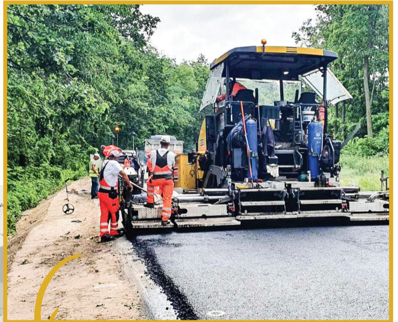
▲ Przebudowa drogi Osieczna - Łoniewo - Kąkolewo wkracza w decydującą fazę.

wej oraz 300 metrów chodnika. Przebudowane zostanie skrzyżowanie w Goniembicach, a ponadto w Goniembicach, Wolkowie i Osiecznej zaprojektowano przejścia dla pieszych i przejazdów dla rowerzystów.